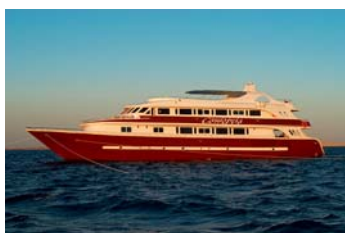
az 5*-os hajó

Ár: repülőjegy illetékkel: 75.000Ft/fő, hajótúra ellátással+próbamerülések+hastánc tanfolyam: 63.500Ft/fő