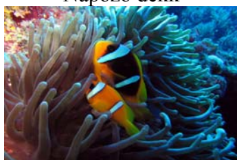
A víz alatti világ